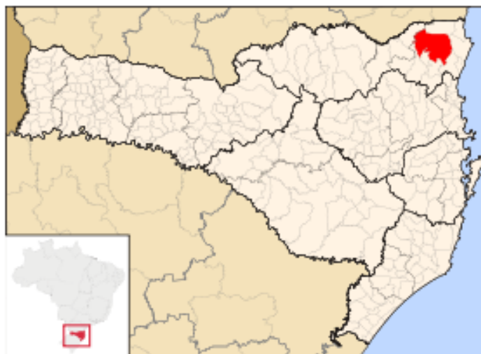
Figura 2: Localização de Joinville em Santa Catarina.

Segundo o IBGE (2015) Joinville é um município localizado na região nordeste de Santa Catarina (Figura 2) com população estimada em 562 mil habitantes. A cidade é cortada pela ferrovia sob concessão da Rumo ALL e sofre com a passagem dos trens no perímetro urbano que causam desconfortos e riscos aos habitantes.